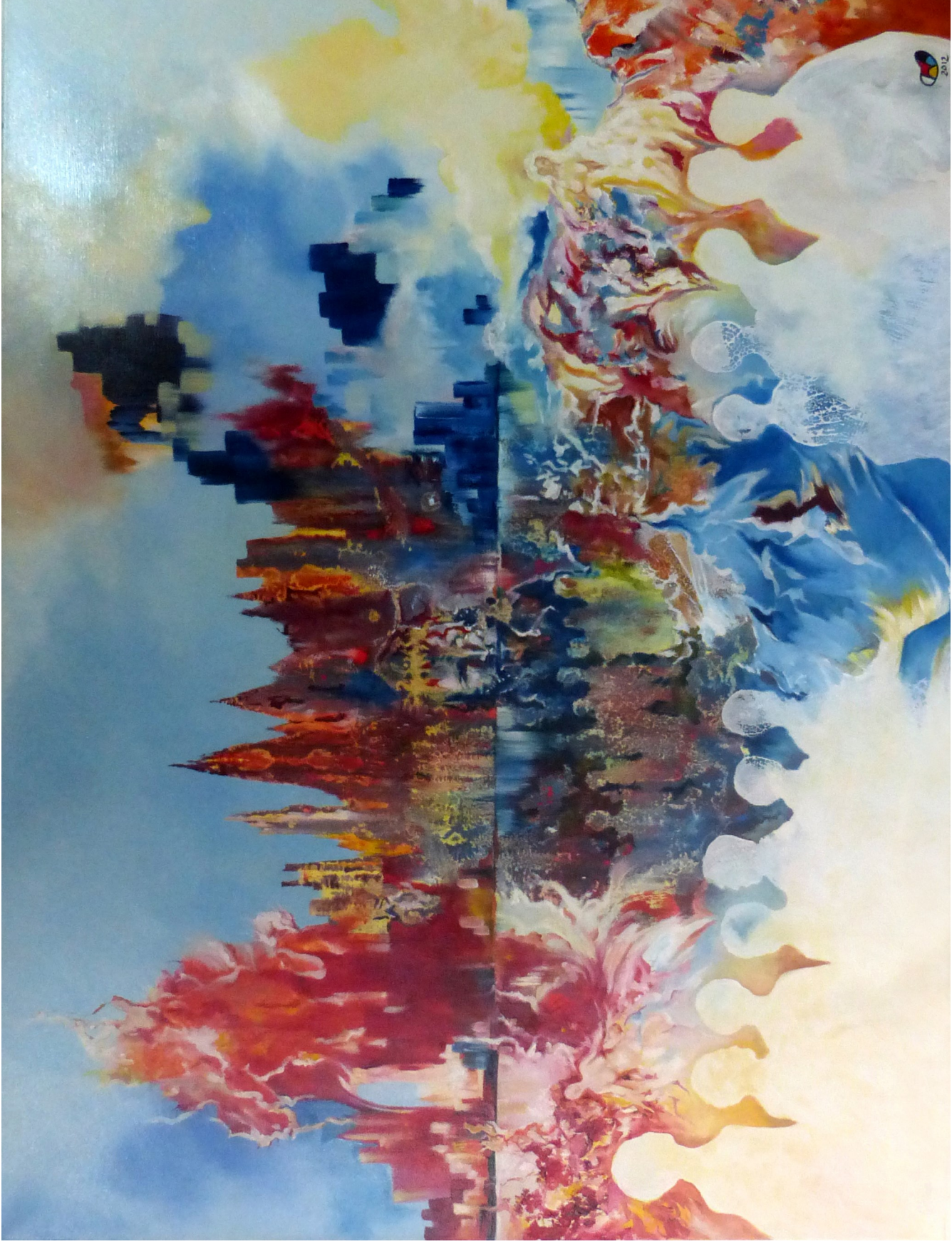
No Choice Oil on Canvas 90 x 120 cm