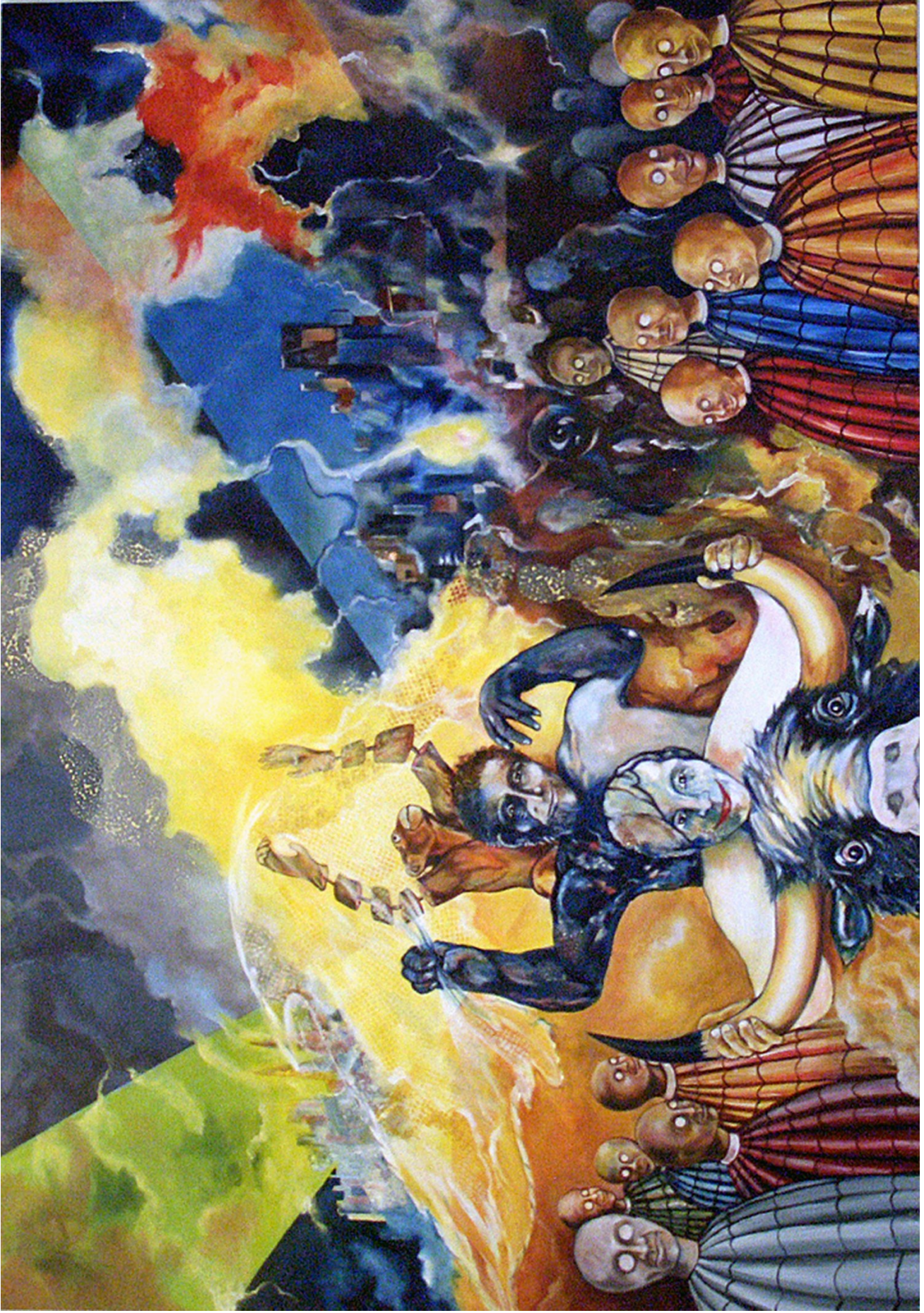
Europeseparate Oil on canvas 150 x 200 cm