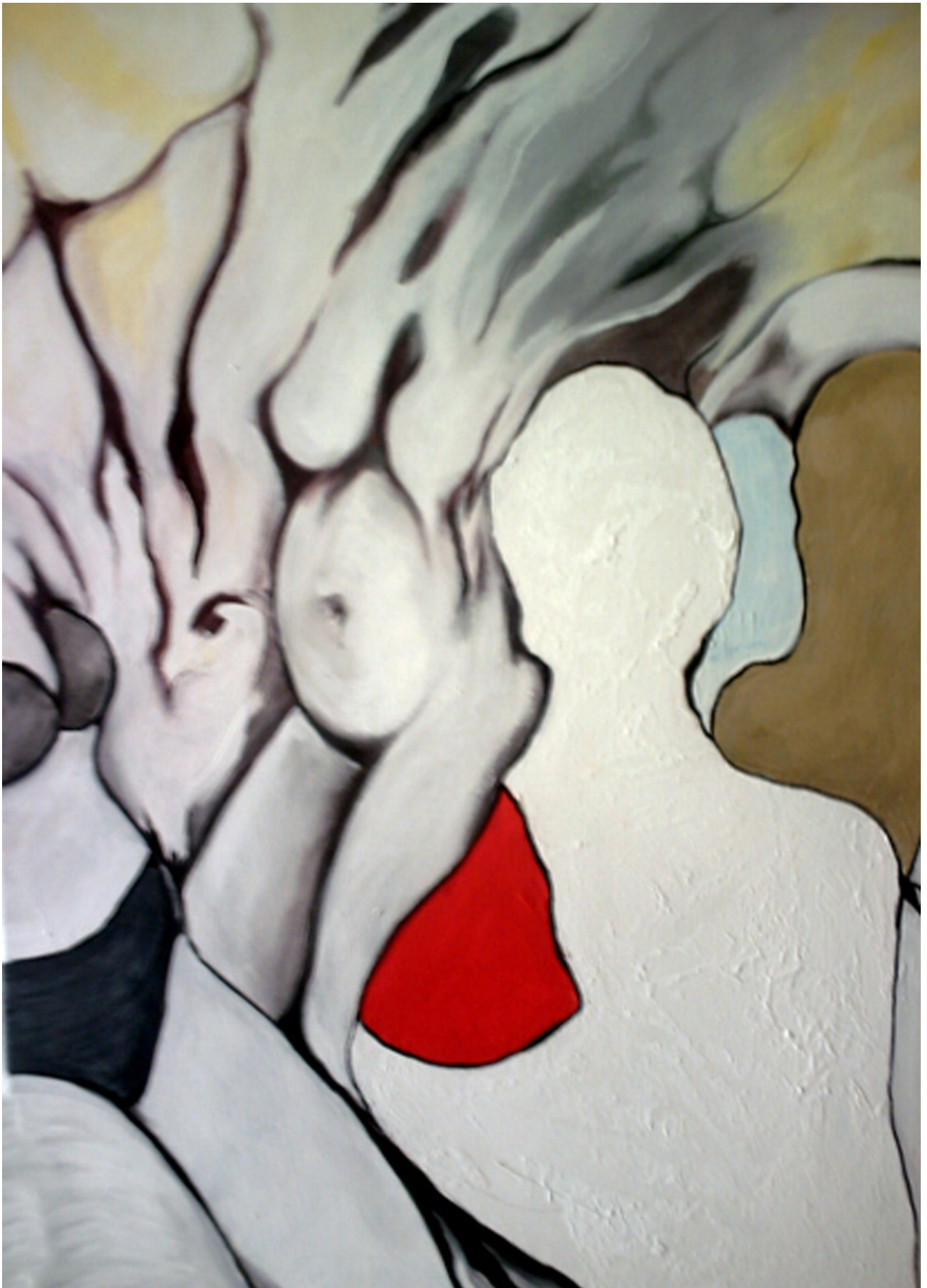
Injured Oil on Canvas 70 x 90 cm