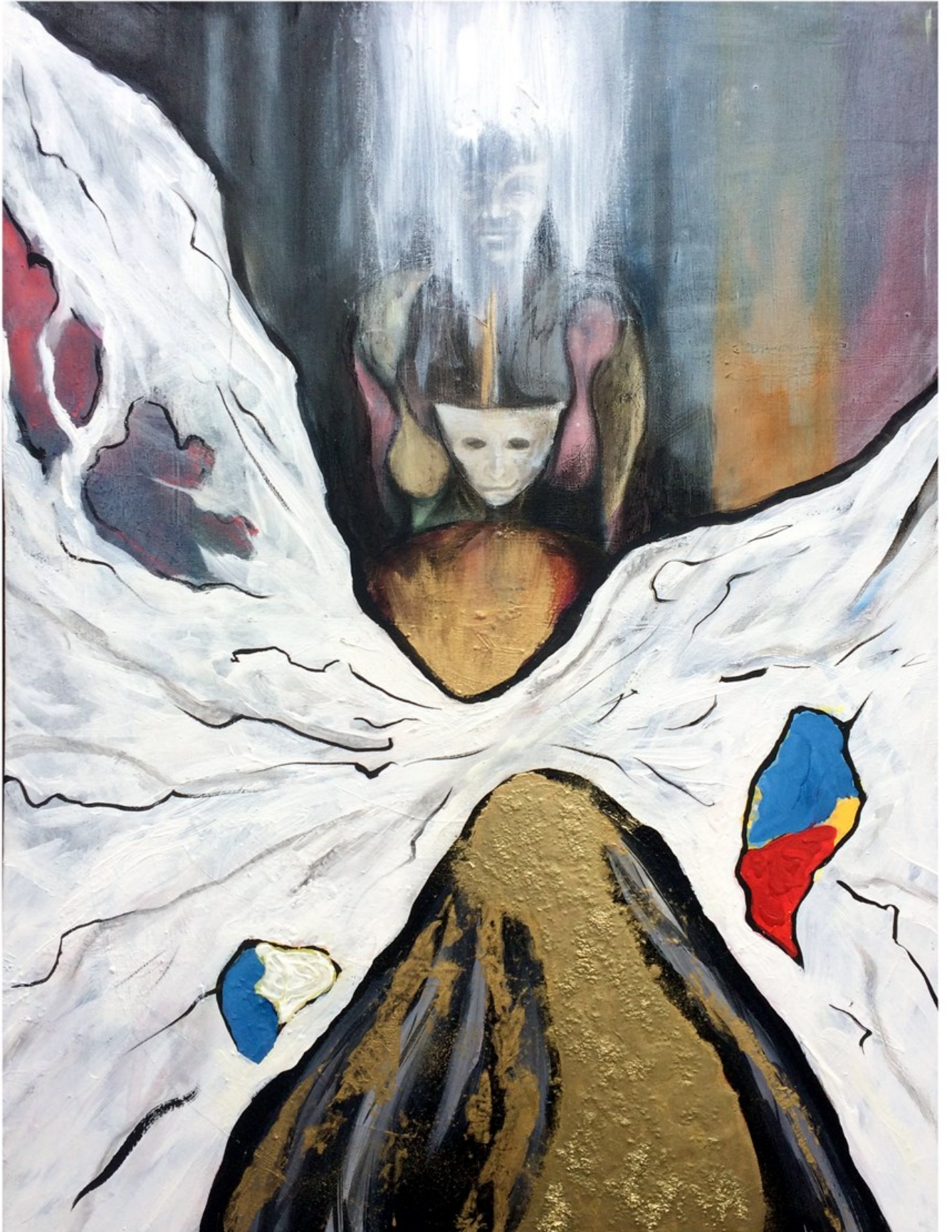
Demask 2017 60x 80 cm oil on canvas